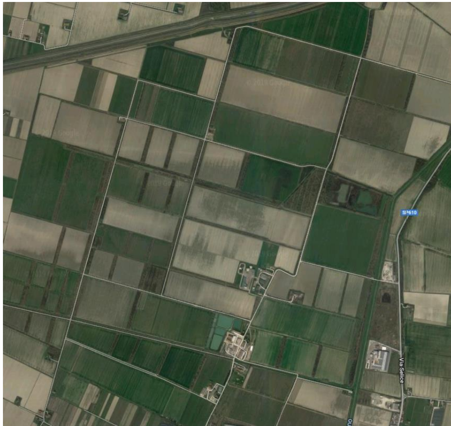
CAB Massari, Conselice